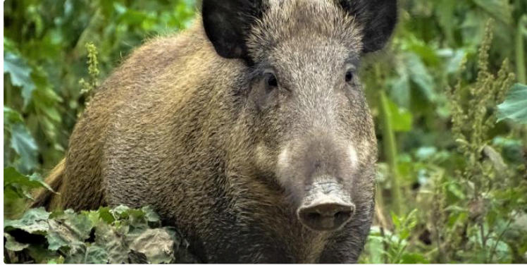
Les sangliers ont profité du confinement

Arrêtées pendant presque deux mois, les battues ont repris. Encore trop tôt pour dire si les dégâts ont augmenté.