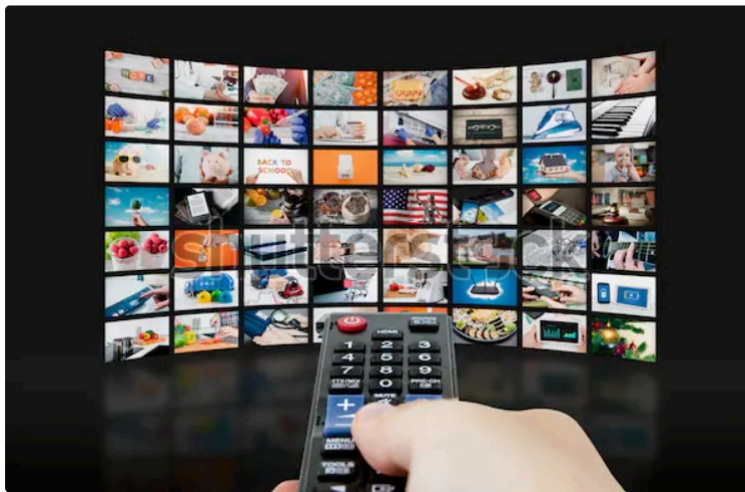
À la télévision, jeudi soir...