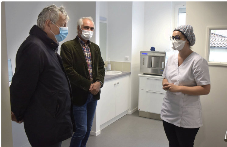
Ouverture du cabinet dentaire à la maison médicale

Rendez-vous à prendre au secrétariat général