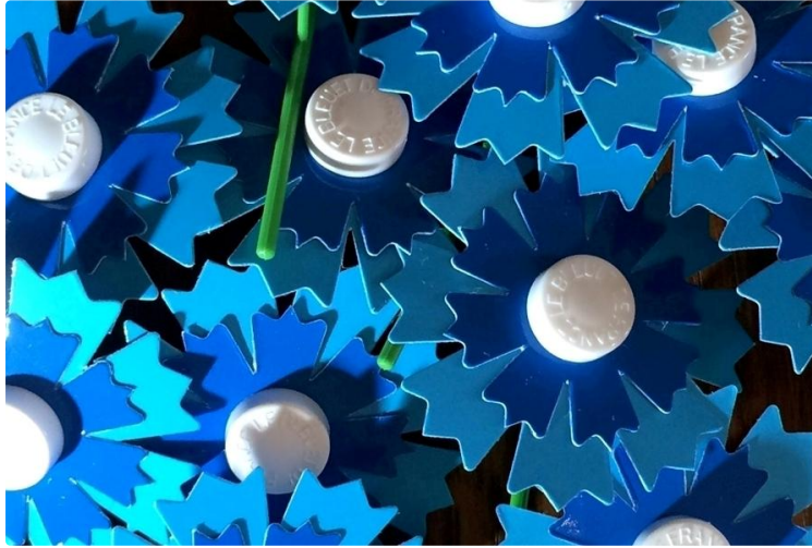
Bleuet de France : annulation des collectes

Pour s'y substituer, une cagnotte en ligne est ouverte