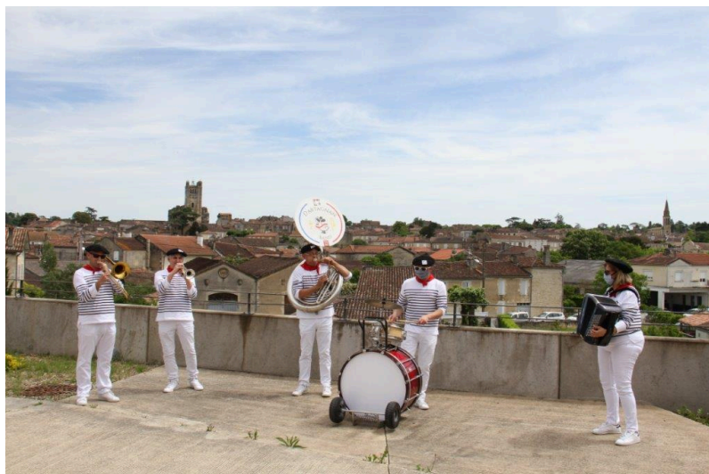
Un détour maintenant par le service des Urgences de l'hôpital de Condom ; les soignants prennent quelques minutes de répit pour venir applaudir la banda.