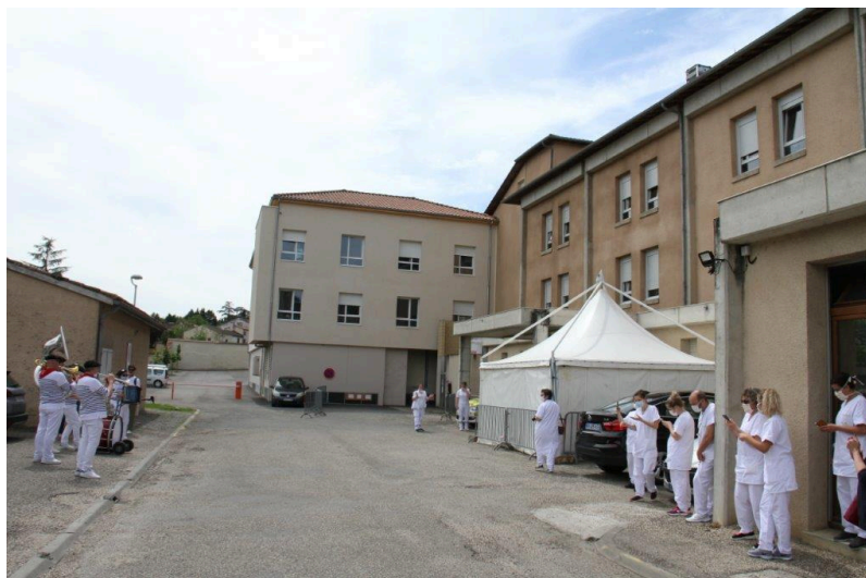
Étape finale pour ce soutien apporté au personnel en blouse blanche : la maison de retraite de l'Hôpital de Condom. L'occasion d'un moment de détente avec un paquito dans les règles ! Attention souvent les photos donnent une impression erronée, les distances entre chacun sont bien respectées.