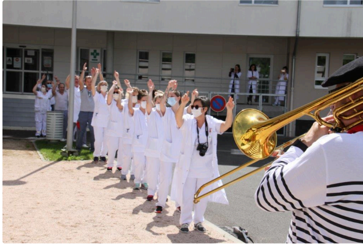
Musiciens et solidaires

Le D'Artagnan Band a entamé, par la capitale des Bandas, un après-midi de marathon musical