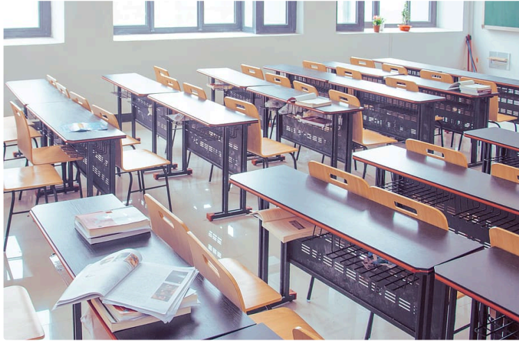
Les parents d'élèves écrivent au Président de la République

Pas beaucoup de solutions en ce moment de confinement pour faire bouger les choses !