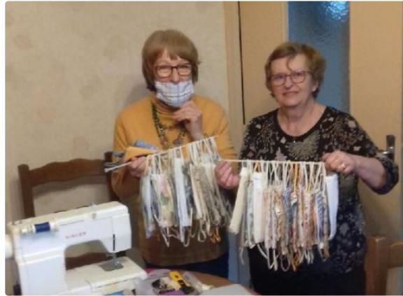
Les petites communes aussi ont de la ressource

À Nougroulet, l'association Les Doigts d'Or est passée du pergamano à la fabrication des masques.