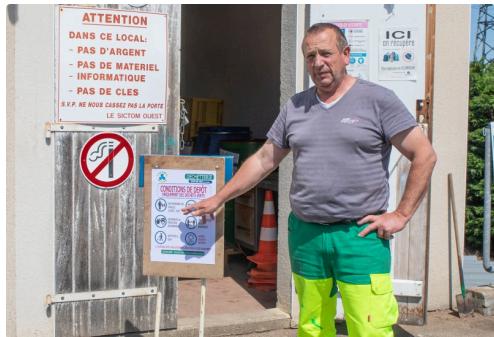
Le gardien de la déchetterie de Nogaro montre les consignes