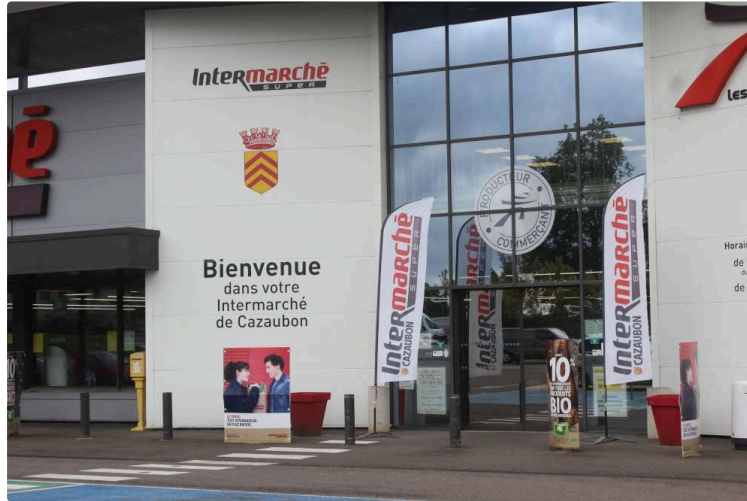
Intermarché respecte les consignes sanitaires

Face à la situation provoquée par le Covid-19, dès le début de l'épidémie, dans le cadre de la lutte contre la propagation du coronavirus, la grande surface Intermarché, conformément aux directives gouvernementales, a procédé à la mise en place de toutes les règles sécuritaires, dans l'intérêt de sa clientèle et de ses employés.