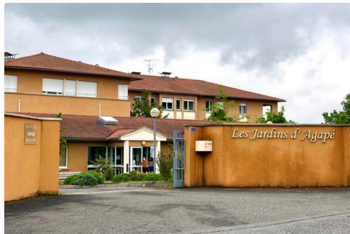
Les premiers tests ont débuté auprès des résidents des Jardins d'Agapé à Auch.

Dans les semaines qui viennent, cette campagne de tests devrait monter en puissance avec la mise en service d'une machine automatique d'analyse des prélèvements à disposition de l'ARS par le GIP Public Labo, basé à Montauban, qui regroupe les laboratoires publics départementaux du Gers, du Lot, du Tarn et du Tarn-et-Garonne.