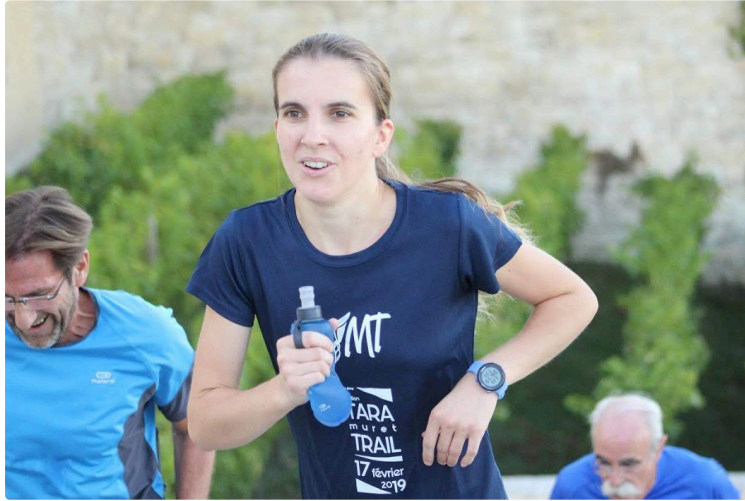
Sport et confinement

Avec ce confinement, de nombreux défis sont nés sur la toile. Quelque soit son niveau, de débutant à compétiteur régulier, le sport reste un espace d'échanges où chacun peut s'exprimer, pour faire rire, envie ou encore pour participer à des événements payants au profit du personnel hospitalier ou de la recherche contre le Covid.