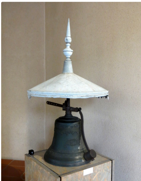
Une cloche d'horloge offerte par Claude Augé