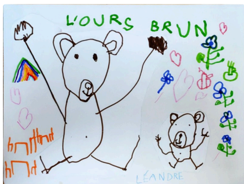
Dessin de Léandre