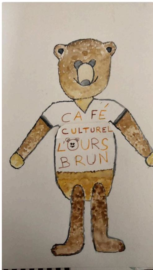
Voici quelques dessins réalisés par les enfants, très sympathiques et humoristiques.....celui-ci est d'Isabelle

Mail : contact@lours-brun.fr - 06 11 72 24 20 - Page Facebook L'Ours Brun