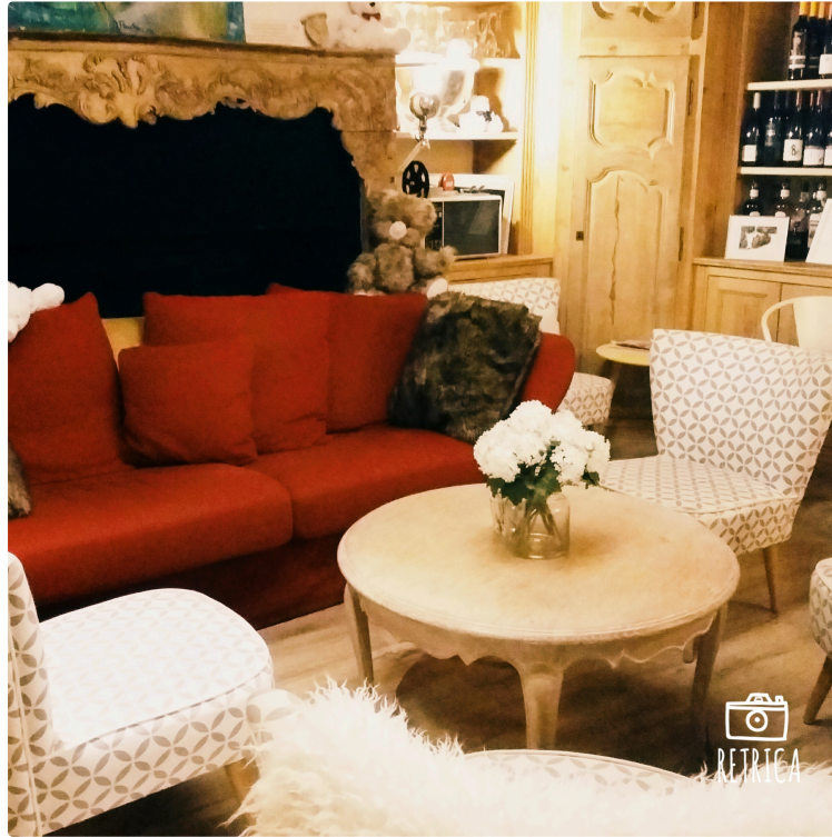
L'Ours Brun : un café culturel à la portée de tous