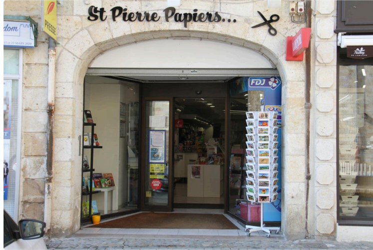
Le retour de la presse Place Saint Pierre

Une seconde ouverture pour St Pierre Papiers, définitive, cette fois, il faut l'espérer !