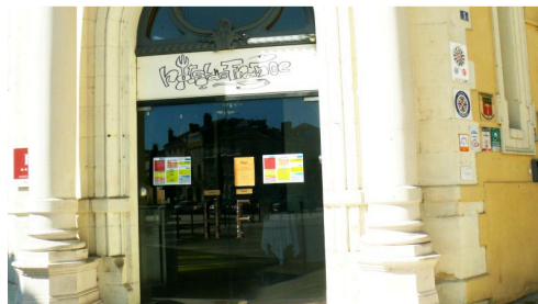
La porte d'entrée de l'hôtel de France est cadenasée.