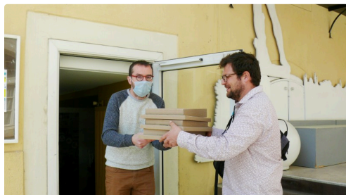
Livraison de plateaux repas.

B C Que ce soit au restaurant ou en hôtellerie nous avons déjà au quotidien les produits antibactériens et antiviraux, de bonnes pratiques auxquelles s'ajouteront le port du masque et la distanciation.