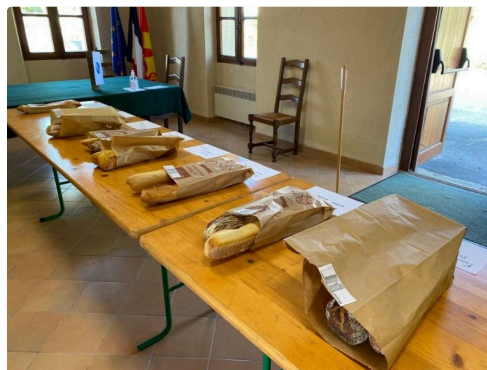
Les commandes attendent leurs clients.