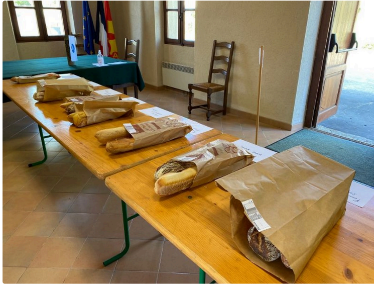
Un service de livraison en place depuis trois semaines