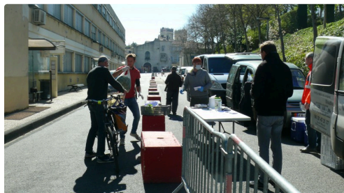
Un consommateur venu à vélo

Pour commander au drive fermier auch CLIC ICI