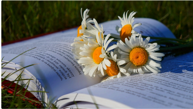
À vos marque-pages !

Chaque premier samedi du mois, le Journal du Gers vous propose une balade chez les libraires et vous révèle leurs coups de cœur du moment.