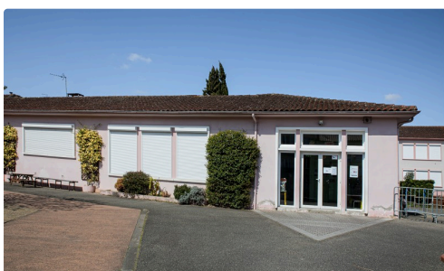
École maternelle de Nogaro

(1) La commune assure les repas ainsi que le nettoyage et la désinfection des locaux. Chaque jour, le nombre d'enfants accueillis est transmis à l'inspection d'académie qui rend compte à la préfecture.