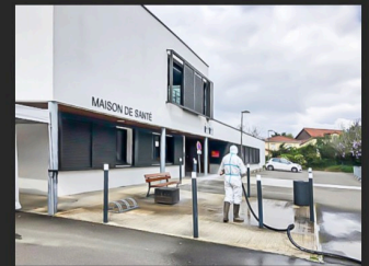
Devant la maison de santé