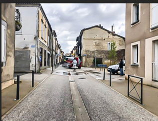
Dans le bas de la rue Nationale