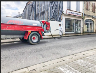
Dans le haut de la rue Nationale

N,B, - Les photos ont été communiquées par Christian Peyret.