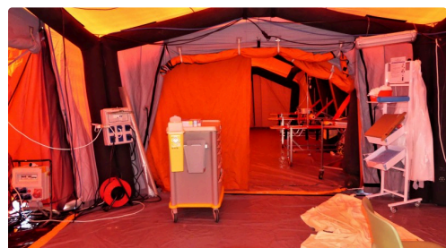
Le PMA : poste médical avancé.

Si vous avez des questions concernant le coronavirus, merci de composer le 0 800 130 000 (appel gratuit) ou de vous rendre sur le site officiel http://Gouvernement.fr/info-coronavirus