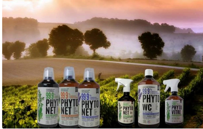
Phytogers à la rescousse face à la pénurie de gel hydroalcoolique

Fervent militant de la cause écologique, ce laboratoire installé à Gavarret-sur-Aulouste depuis 1985 joue la carte de la solidarité en produisant ce qui est devenu, depuis le début de la crise du Coronavirus, une denrée rare.