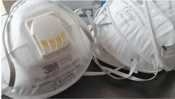
Les infirmières libérales gersoises tirent la sonnette d'alarme

Suite à leur manque de moyens de protection, elles lancent un appel aux dons.