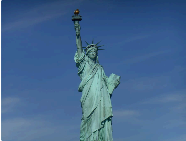
Adressé à un "Très cher humain", un article signé par un anonyme

En fait, cet écrivain se présente comme un ennemi qui nous veut (peut-être) du bien : le coronavirus.