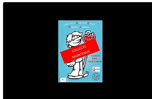
affiche avec aignan lundi 23 mars .JPG

Aucune crainte à avoir pour les donneurs : avec les équipes EFS, les mesures distances physiques, masques et gants seront respectées pour les donneurs bénévoles,