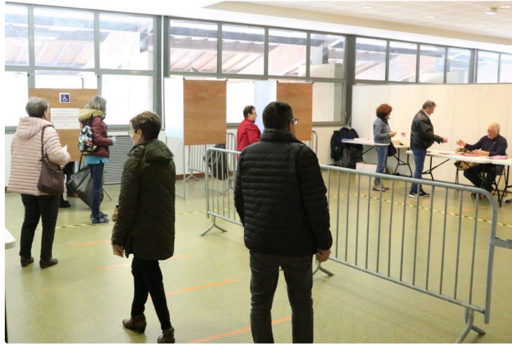
Un bulletin de vote mal imprimé a sans doute faussé le classement de ce premier tour