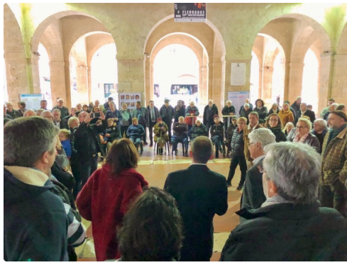
12 mars 1.jpg