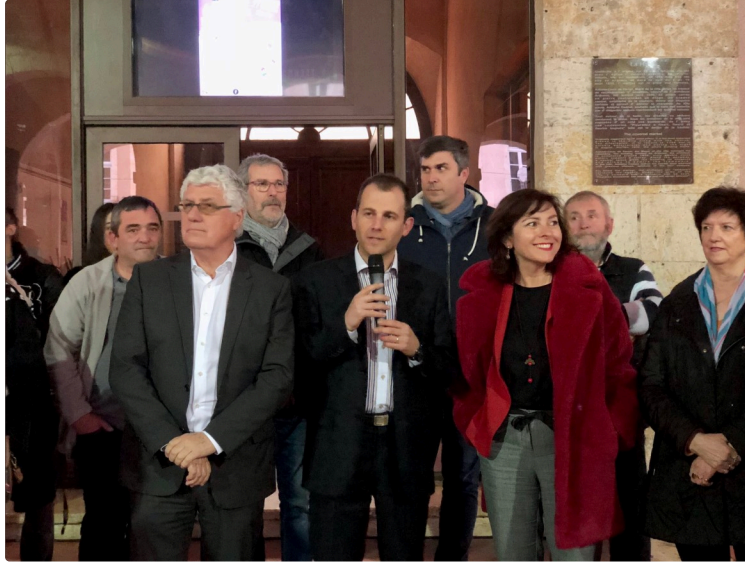
« Fleurance Demain Autrement » reçoit les appuis de Carole Delga et Philippe Martin