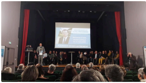
11 mars 1.jpg