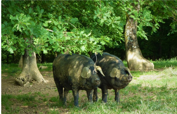
Le porc Noir de Bigorre, passionnément

Menacé de disparition, le porc emblématique des Pyrénées a reconquis le cœur des consommateurs, grâce à une poignée d'éleveurs fermement résolus à le préserver.