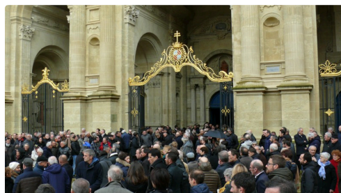
Un millier de personnes ont assisté aux obsèques.