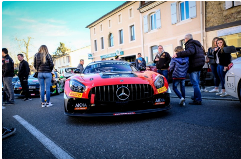
Parade dans Nogaro en 2018