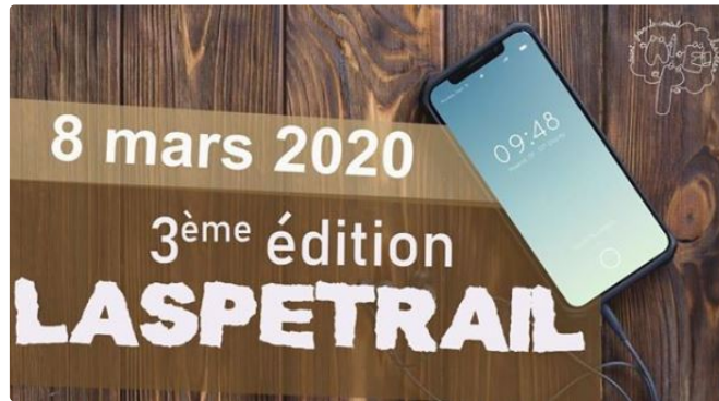
3ème édition de Laspetrail pour l'école

L'Association des Parents d'élèves St Jean-le-Comtal-Lasséran organise, pour la 3e fois,, le dimanche 8 mars prochain, Laspetrail, un événement sportif ayant pour objectif de collecter des fonds au bénéfice des projets pédagogiques de l'école.