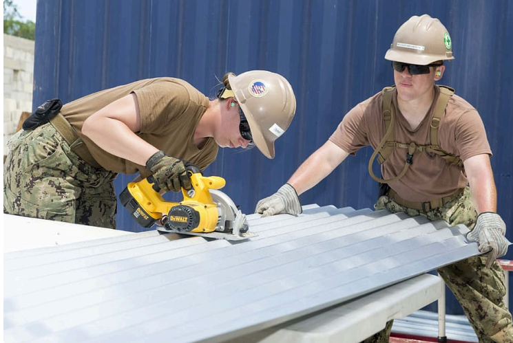
Le Bâtiment innove pour favoriser l'emploi