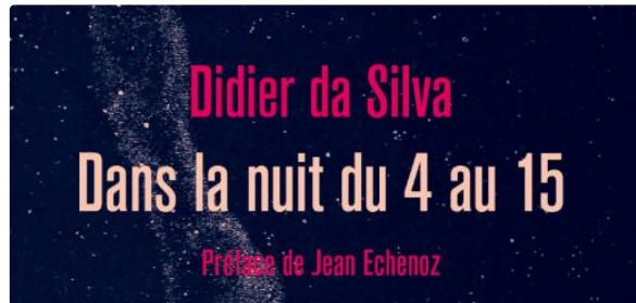
« Dans la nuit du 4 au 15 »