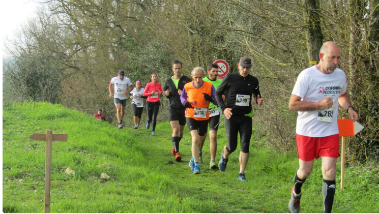
Les amateurs de course à pied se sont tous retrouvés à Avezan, ce dimanche

Pour le troisième épisode du Défi Gersois, cette année.