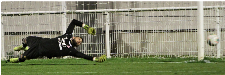
Football National 3 : Auch craque en seconde mi-temps face à Rodez 2.

Après une première mi-temps d'un excellent niveau, les Auscitains ont déjoué en seconde période.