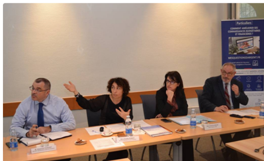
Commission de surendettement : bilan 2019