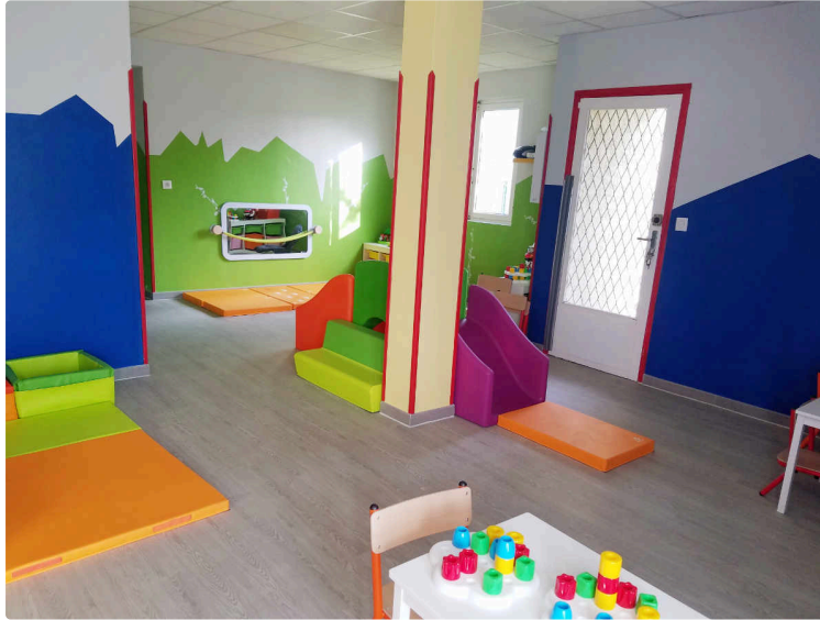
Jeunes parents à la recherche d'une solution pour faire garder bébé

Une nouvelle opportunité s'offre à vous avec la micro-crèche qui s'installe à un endroit facile d'accès sur la route de Segoufielle.