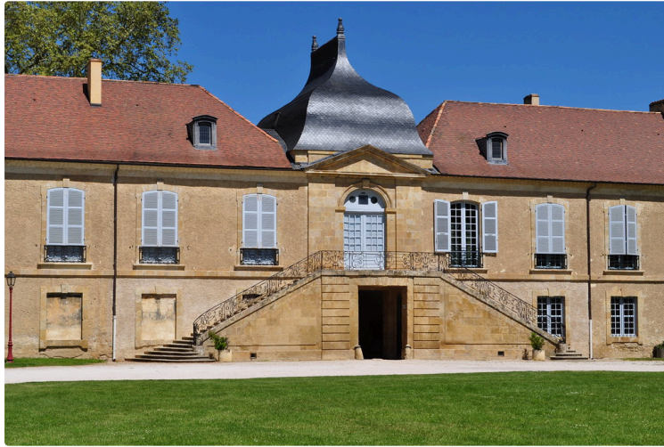
Les châteaux du sud du Gers à l'honneur