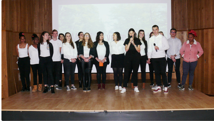
Les attentes des seniors passées à la loupe par les lycéens de Beaulieu-Lavacant

Ce sont dix-neuf lycéens en première année de BTS développement et animation des territoires ruraux de Beaulieu-Lavacant qui ont présenté publiquement, le 6 février, le résultat de leur enquête sur les attentes des seniors de Pavie et alentour. Dans la salle Bernard IV de la médiathèque de Pavie, étaient présents les maires de Pavie, Auterrive, Boucagnères, Haulies, Lasseran, Lasseube-Propre et Pessan, lesquels ont répondu au questionnement de l'enquête tout comme des responsables associatifs, des professionnels, autres élus de collectivités et un panel de 350 habitants de 60 ans et plus.