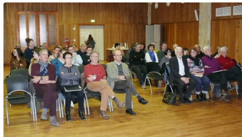
Les élus des communes étaient présents pour assister au rendu de l'enquête.