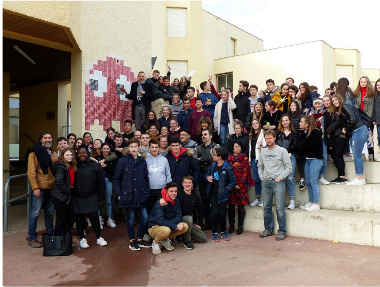
Rendez-vous est donné par les élèves de Beaulieu-Lavacant ... dans vingt ans

Après en avoir appris de toutes les couleurs sur les évolutions possibles du monde agricole, les élèves et les nombreux participants de ces journées scientifiques du lycée agricole de Beaulieu-Lavacant se sont réunis autour de l'œuvre artistique imaginée et créée, en ces deux jours, avec l'aide des 125 secondes du lycée agricole, afin de clore ces deux journées riches en découvertes.