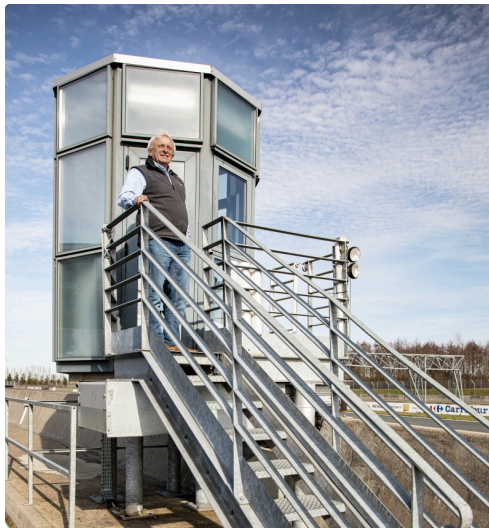
Sur la tourelle de la ligne d'arrivée