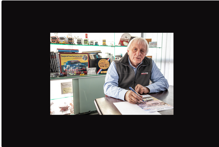
Le rallye TT « Gers-Armagnac » renaît « Terres d'Armagnac »