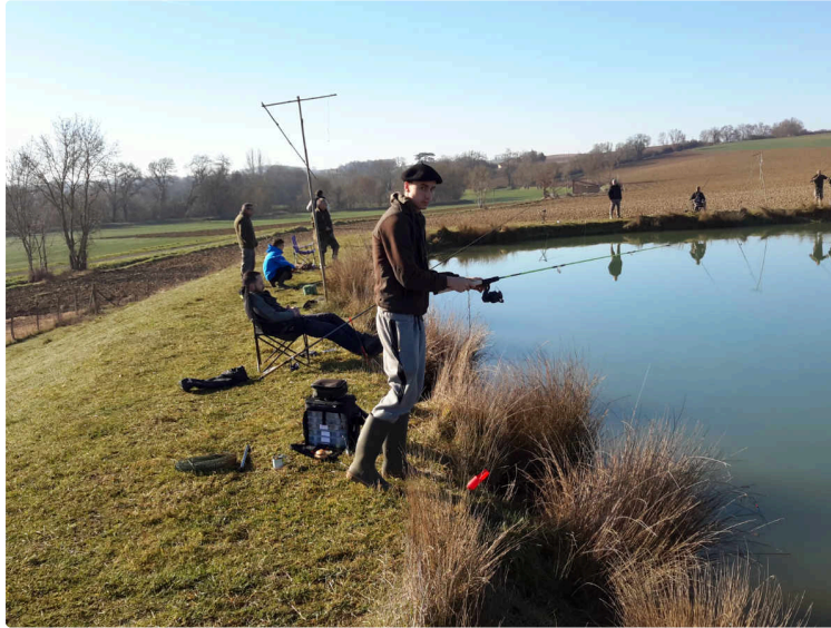
Reprise pour la saison de pêche

La société de pêche de Jegun informe de la reprise des journées truites au lac du Houreste, chez Monsieur Caverzan, à Jegun ; le chemin sera fléché depuis Jegun.