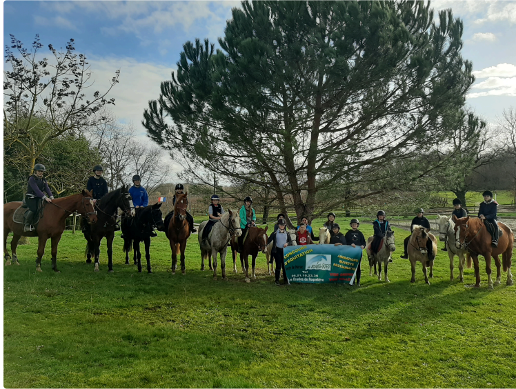
Une étape de l'Occitanie Tour Club, support du Championnat Régional

Mais en même temps une étape du Circuit Départemental, tout cela aux Écuries de Roquebère, le dimanche 9 février