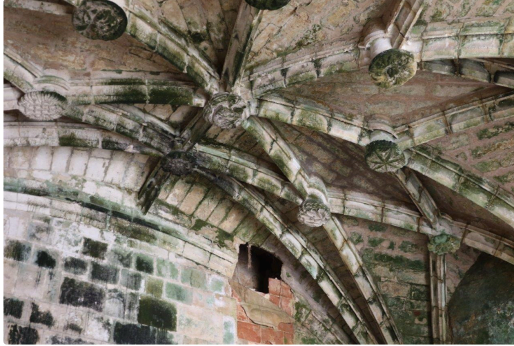
Le bâtiment le plus emblématique de la ville est dans un état lamentable

Les photos parlent d'elles-mêmes... la situation est plus que préoccupante