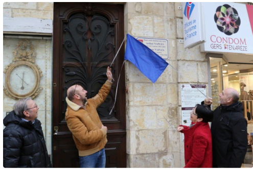
Le moment fatidique où la plaque est dévoilée !