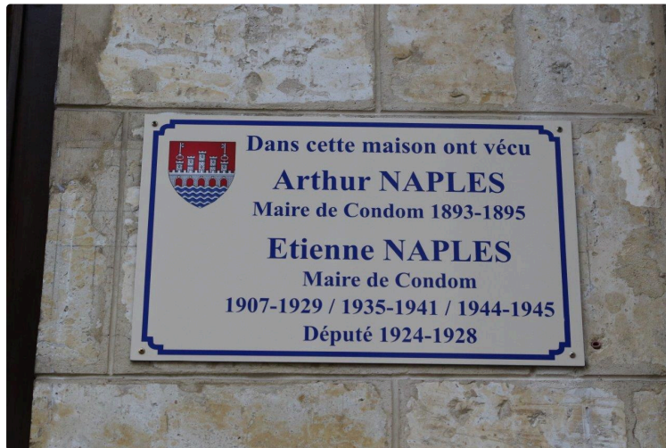
Naples, un nom qui fleure bon la Méditerranée...

...mais pour la cité condomoise, un patronyme à honorer