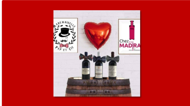
Chez Madiran & Mademoiselle pap' & Cie

Quand deux jeunes entreprises s'associent pour valoriser leur savoir-faire