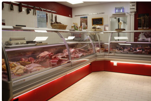
Vidou 25012020 (5) [1280x768].JPG

Il est possible de se reporter à notre précédent article pour connaître les fournisseurs locaux de la Boucherie du Coin.