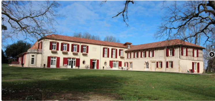
La Maison Sainte-Marie un havre de paix