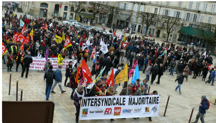
Le chef-lieu plaque tournante pour les grévistes

Grèves : résumé sur trois journées denses