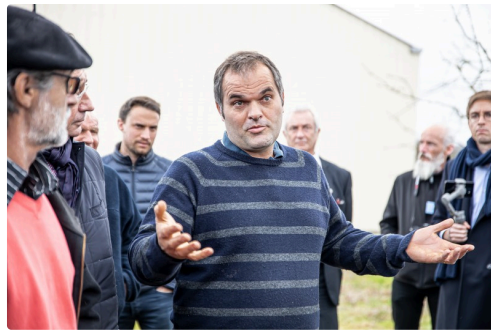
Intervention d'un agriculteur à Ricourt