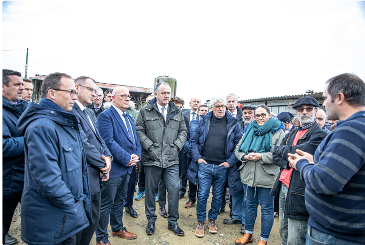
Le ministre de l'Agriculture à Ricourt et Verlus

Retour sur ses visites l'après-midi du 10 janvier